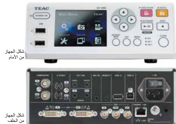
شكل الجهاز من الأمام